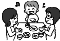
家族で食卓を囲む時間をつくる